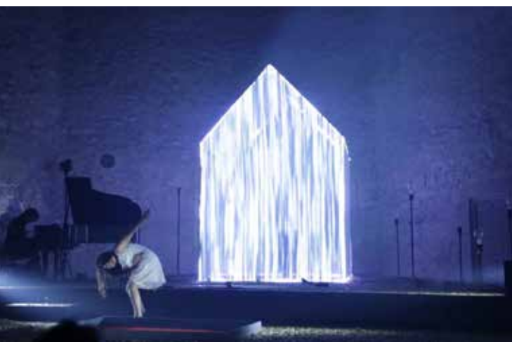
Figura 8 Casa de la Memoria (2015).

dois grandes estúdios de design barceloneses, o Tigrelab (que realizou os conteúdos em 2D e 3D e para os LEDs) e o ProtoPixel (que executou o mapping dos Leds), além de contratar o artista Xavi Gibert como diretor técnico e Joan Teixidó para realizar o design de iluminação.