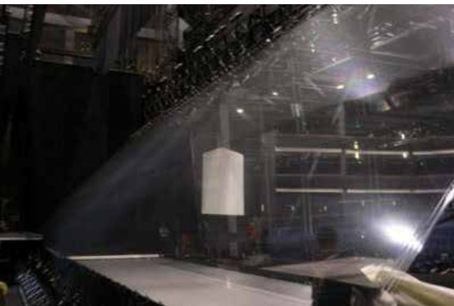
Figura 2 Palco com material da emulsão Eyeliner 3D preparado para receber projeções.