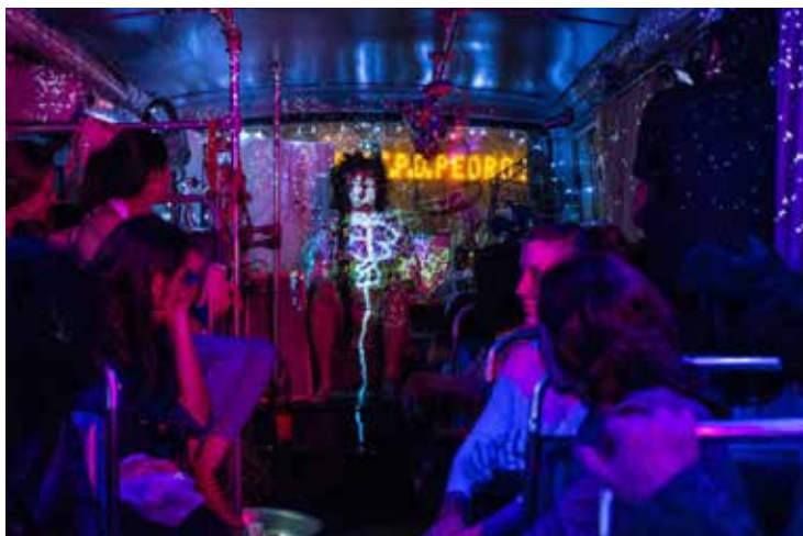
Figura 10 Iracema via Iracema, Agrupamento Andar7 (2014).

Após identificarmos alguns notáveis espetáculos que incorporam as tecnologias da atualidade, podemos seguir para as considerações finais de nosso texto, onde resumiremos os desafios a serem enfrentados nesse tipo de produção.