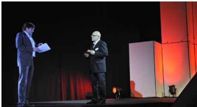
Figura 3 Projeção sobre a emulsão Eyeliner 3D, simulando a tele-presença 5

Uma das principais razões para que a holografia ainda não seja plenamente realizada nos palcos é o seu alto custo e por demonstrar ser “pouco eficiente” por “permitir apenas a criação de imagens estáticas” (ALBUQUERQUE, 2014, p. 10), porém, já foram criadas técnicas para produção de holografia em movimento e em tamanho real (idem). Dessa forma, simulações de holografia são anunciadas como a execução legítima da técnica, até mesmo em circunstâncias diversas aos espetáculos musicais. Nos últimos tempos, a notícia de que uma manifestação holográfica foi realizada na cidade de Madrid, na Espanha, causou alvoroço nas redes sociais. Contudo, na realidade, o protesto ocorrido no dia 10 de abril de 2015, contra a chamada “Lei da Mordaza”, a qual pune com multas altíssimas qualquer tipo de protesto ou reunião pública sem autorização do governo utiliza claramente esta técnica “pseudo-holográfica”. 6