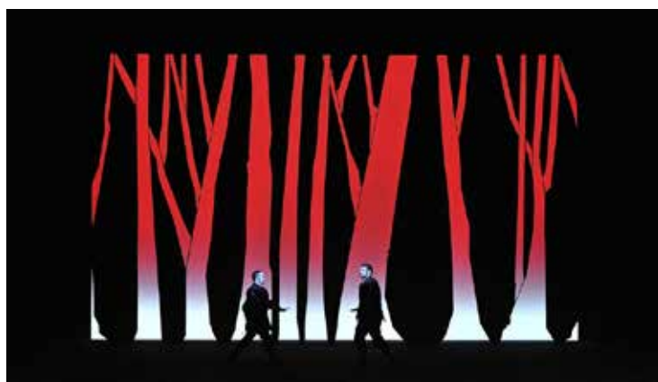
Figura 6 Macbeth (2012) com cenografia de Robert Wilson.

O cenógrafo Robert Wilson ou apenas Bob Wilson 12 atua no ambiente teatral desde de a década de 1960. Sua obra singular é definida por Cyro del Nero (2008) como “um teatro feito de “visões” que transcorrem lentamente, com propostas insólitas e incomparavelmente belas e poéticas” (p. 277). Um grande diferencial de sua obra é a aplicação da iluminação de maneiras surpreendentes.