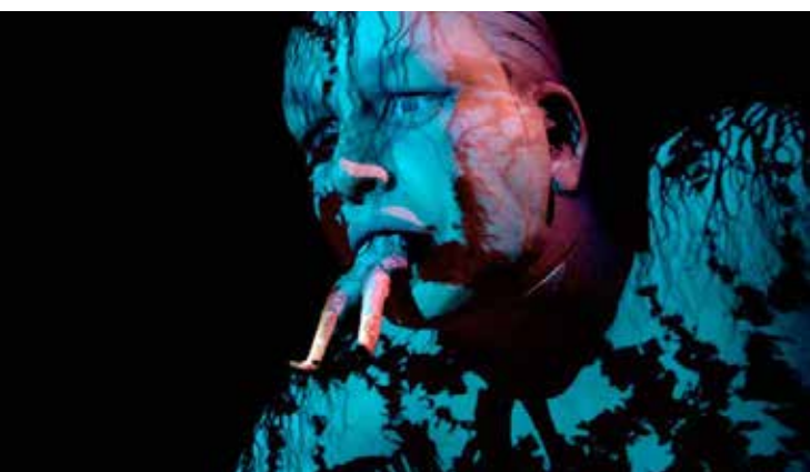
Figura 5 Ópera Le Grand Macabre (2009) da Fura del Baus.

A Fura del Baus 11 foi formada em 1979, na cidade de Barcelona, a princípio como um grupo de atores e performers que atuavam em espetáculos de rua, e que com o tempo foram experimentando novas formas narrativas e cenográficas e acabaram por desenvolver uma linguagem própria, a qual denominam como “ lenguaje furero ”. Atualmente a Fura é um grupo cênico e performático reconhecido mundialmente e que produz espetáculos grandiosos com altos investimentos em cenários tecnologicamente inovadores e grandiosos, conforme podemos observar na imagem da Ópera Le Grand Macabre (figura 5), apresentada em 2009 e dirigida por Álex Ollé e Valentina Carrasco.