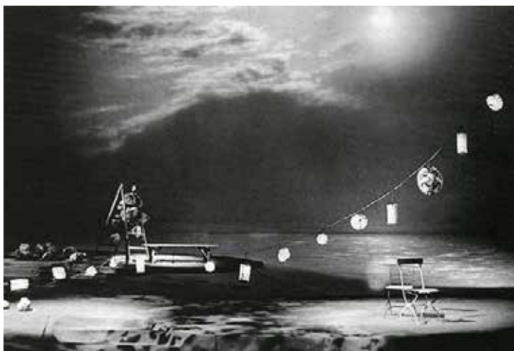
Figura 4 Cena da produção Sunday of August (1959) do grupo Lanterna Magika 9

O próximo item de destaque apontado nesta mesma obra, data do final de 1950, o grupo Lanterna Magika , surge em 1958 através da iniciativa de Joseph Svoboda (1920 – 2002) e Alfred Radok (1914 – 1976) e está baseado na cidade de Praga. O grupo se encontra em atividade até os dias de hoje e produz espetáculos em que combina a encenação de atores e a arte da projeção