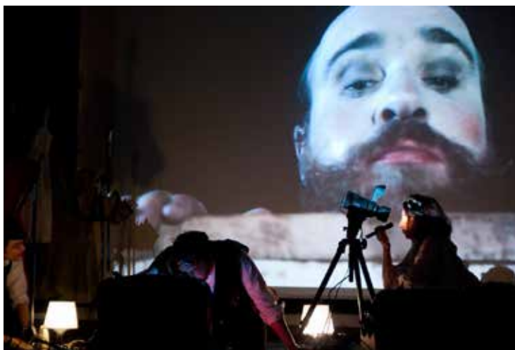
Figura 7 Cena de Kadâmbini (2010), espetáculo inspirou o software Millumin . 14