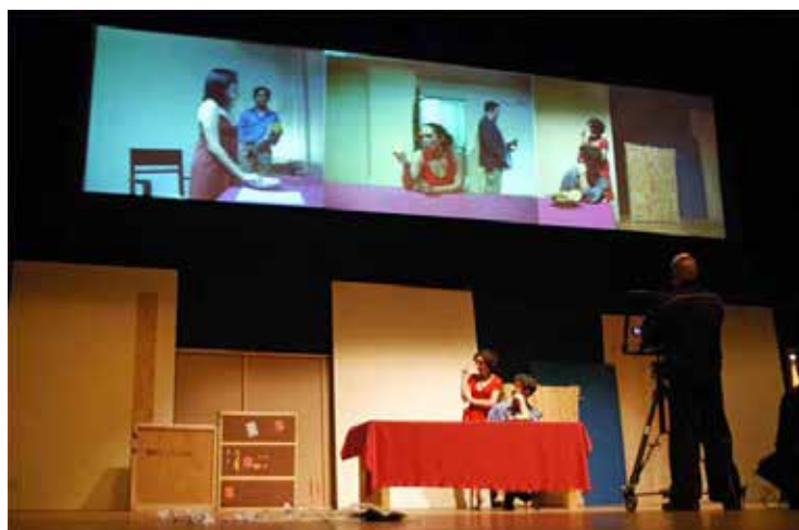
Figura 9 'Play On Earth', da Cia Phila 7 e Station House Opera, 2008.